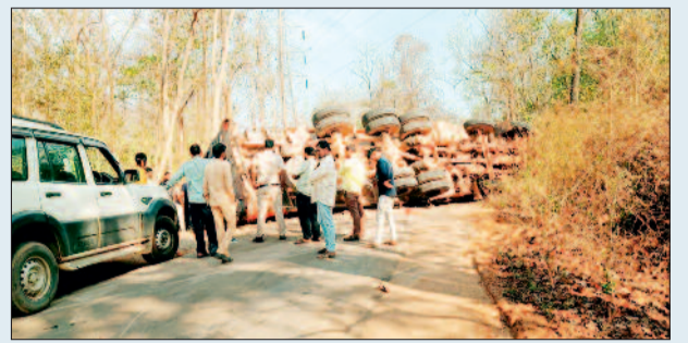
10 किलोमीटर दूर से मंगवाई क्रेन, दिखाई जबरदस्त तत्परता