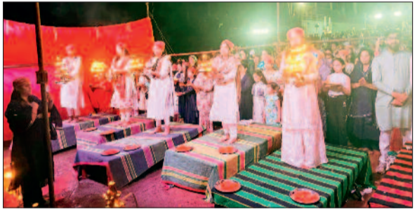
पूज्य सिंध समाज ने चेट्टीचंड पर्व धूमधाम से मनाया