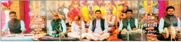
लोहरसी में मानस गान की गूंज