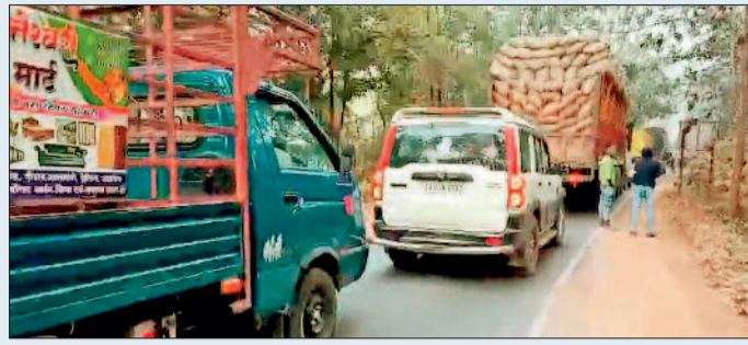
हाईवे सड़क किनारे सोल्डर में जानलेवा गड़बड़े

रायपुर मैनपुर देवभोग से ओडिशा को जोड़ने वाला नेशनल हाईवे 130 सी मुख्यमार्ग में लगातार दुर्घटनाओं के चलते सड़क जाम हो रही है। आए दिनों सैकड़ों वाहनों की काफीला जंगल में फंस रही है। हजारों यात्री परेशान हो रहे हैं लेकिन इस मुख्य मार्ग के चौड़ीकरण और मरम्मत के तरफ संबंधित विभाग द्वारा ध्यान नहीं देने से क्षेत्र के लोगों का आक्रोश बढ़ता ही जा रहा है, पिछले 8 माह के भीतर इस मार्ग में 50 से ज्यादा लोग दुर्घटना के शिकार के चलते मौत के गाल में समा चूके हैं और सैकड़ों लोग घायल हुए हैं। आज रविवार को एक बार फिर इस मार्ग में मैनपुर से महज 18 किमी दूर कोदोमाली के पास सिमेंट से भरा ट्रक सड़क के बीचोबीच पलट गया जिससे इस मार्ग में दोनो ओर 10 किमी तक जाम लग गई है और कोई भी वाहन पार नहीं कर पा रहा है जिसके कारण हजारों यात्री जंगल में फंसे हुए हैं। वहीं पुलिस प्रशासन द्वारा सड़क बहल करने की किया जा रहा है। नेशनल हाईवे 130 पर एक बड़ा हादसा उस समय सामने आया जब कोदोमाली के पास खतरनाक मोड़ पर सीमेंट से लदा ट्रक अनियंत्रित होकर पलट गया। ट्रक पलटते ही उसमें भरी सैकड़ों सीमेंट की बोखियां सड़क पर बिखर गईं और कुछ ही मिनटों में पूरा हाईवे जाम की गिरफ्त में आ गया दोनों ओर वाहनों की लंबी कतार लग गई है।