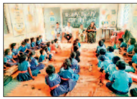
■ तोतली बोली में बच्चों ने बिखरे सूर

ग्राम पतौरा में इन दिनों बच्चों की खिलखिलाहट और रंग-बिरंगी गतिविधियों से माहौल खुशनुमा बना हुआ है। महिला एवं बाल विकास परियोजना किंगेश्वर के अंतर्गत राष्ट्रीय पोषण माह के अवसर पर आंगनबाड़ी केंद्रों में कुपोषण दूर करने और बच्चों के सर्वांगीण विकास को लेकर विविध कार्यक्रम आयोजित किए जा रहे हैं। इसी क्रम में ग्राम पतौरा के आंगनबाड़ी केंद्रों की कार्यकर्ताओं और सहायिकाओं द्वारा प्राथमिक शाला पतौरा में "बड़ी-बड़ी बाल मित्र चौपाल" का आयोजन किया गया। इस आयोजन में छोटे-छोटे बच्चों ने अपनी प्रतिभा का मनमोहक प्रदर्शन किया और पूरे वातावरण को आनंदमय बना दिया।